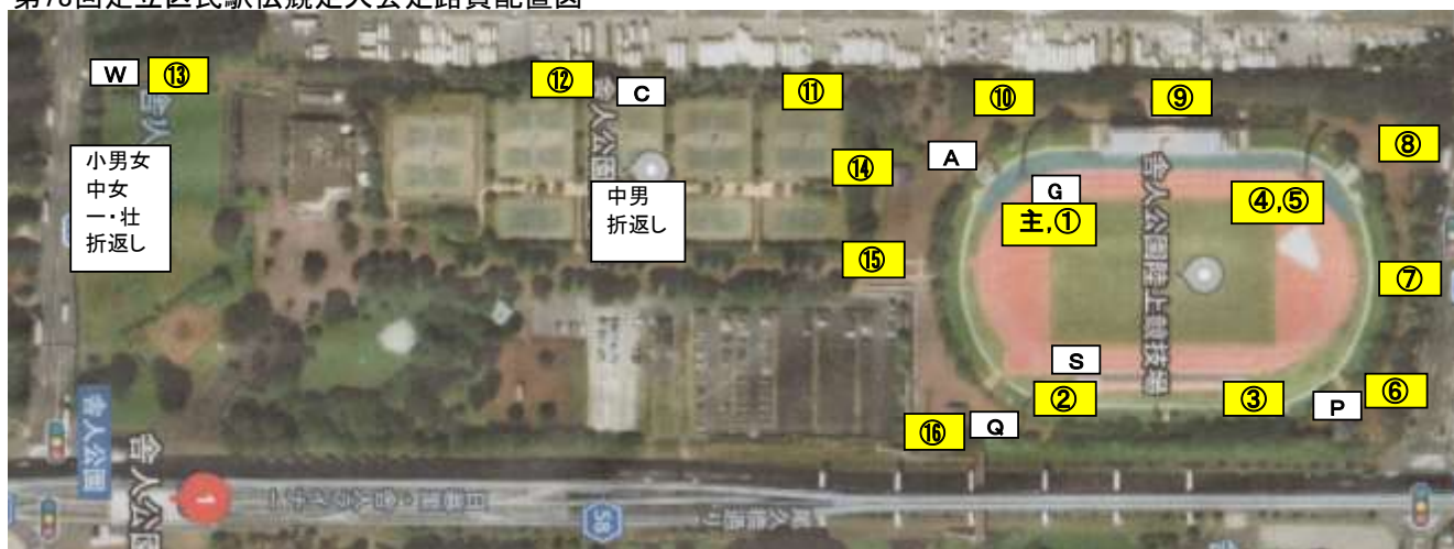
第78回足立区民駅伝競走大会走路員配置図