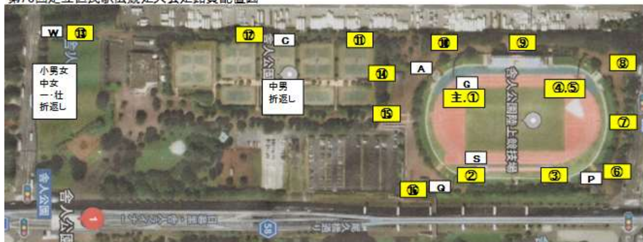
第78回足立区民駅伝競走大会走路員配置図